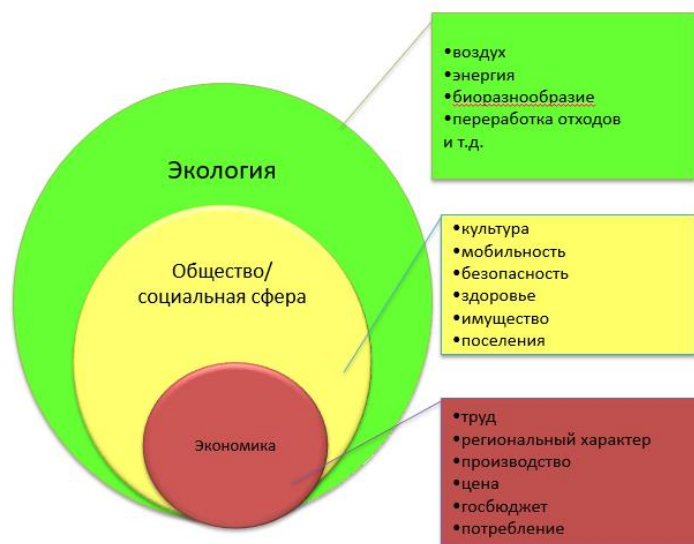
Модель сильной устойчивости развития

Благоприятная окружающая среда и рациональное использование природных ресурсов являются фундаментальным принципом модели сильного устойчивого развития, благодаря этому обеспечиваются основные условия для жизнедеятельности человека, биоразнообразия и возобновления природных ресурсов. Благоприятной является такая окружающая среда, качество которой обеспечивает устойчивое функционирование естественных экологических систем, природных и природно-антропогенных объектов.