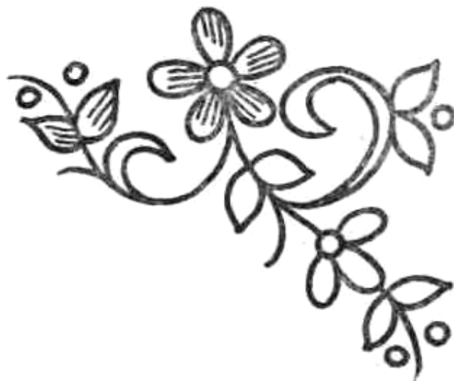
Схема для вязания