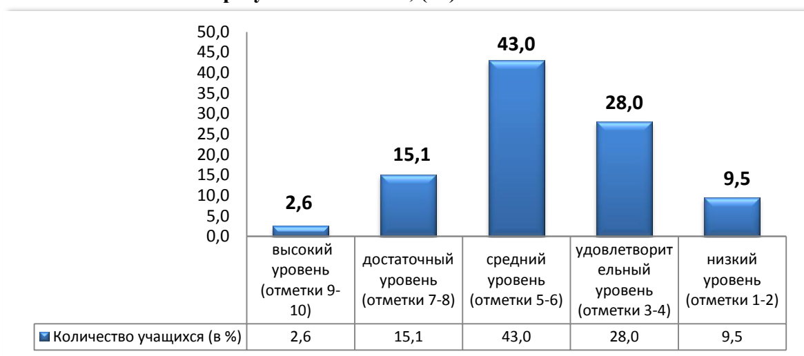
Диаграмма 1. — Распределение учащихся VII класса по уровням усвоения учебного материала в соответствии с результатами РКР, (%)

Результаты РКР позволяют сделать вывод о том, что учащиеся дали наибольшее количество правильных ответов при выполнении заданий, относящихся к первому уровню усвоения учебного материала (в среднем 84,0 % учащихся), наименьшее — к пятому (в среднем 4,0 % учащихся). Количество учащихся, которые дали правильные ответы при выполнении заданий, относящихся к I—V уровням усвоения учебного материала, представлено в диаграмме 2.